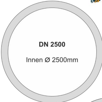
SchachtFIX SW 2500