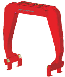
max. Traglast 3500 kg