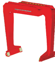
max. Traglast 2500 kg